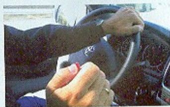
Arriba: El interruptor provisional se activa cómodamente. Abajo: Riguroso conductor en cuanto tenga la legislación vigente.

El vehículo con la centralita Adonis mejora ostensiblemente las prestaciones, sin afectar al consumo, y lo que es mejor a la fiabilidad y la vida del motor. La conducción se hace más agradable y se facilitan enormemente ciertas maniobras como los adelantamientos, el arrastrar remolques, o el rodar a plena carga por poner unos ejemplos. Su costo es un valor despreciable respecto al del vehículo, y ante la I.T.V. no tenemos más que desactivarla para que nuestro Toyota se mantenga de estricta serie. La mayor pega viene por la, de momento insalvable, pérdida de la garantía del fabricante al ser un accesorio no oficial de la marca.