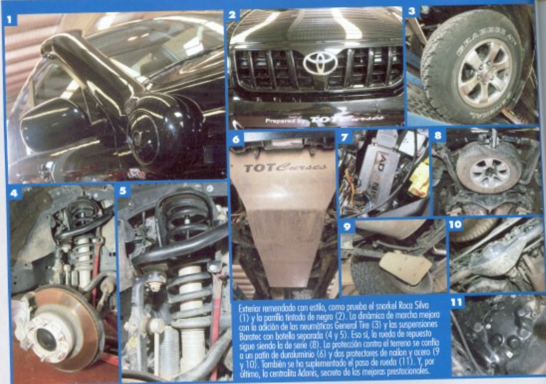
Exterior remendado con estilo, como prueba el snorkel Roca Silver (1) y la parrilla tintada de negro (2). La dinámica de marcha mejora con la adición de los neumáticos General Tire (3) y las suspensiones Baratec con botella separada (4 y 5). Eso sí, la rueda de repuesto sigue siendo la de serie (8). La protección contra el terreno se confía a un patín de duraluminio (6) y dos protectores de nailon y acero (9 y 10). También se ha suplementado el paso de rueda (11). Y, por último, la centralita Adonis, secreto de las mejores prestaciones.

A fin de aumentar su aplomo en toda clase de terrenos, Tot Curses instaló un juego de separadores de rueda de tres centímetros en ambos ejes, posteriormente rebajados a 2 cm, a fin de mantener el flanco del neumático dentro del plano vertical de las aletas de fábrica. Por cierto, las gomas de serie también han sido reemplazadas por unas mixtas de la firma americana General Tire en medidas 265/70 R17 calzadas sobre la llanta de aleación original.